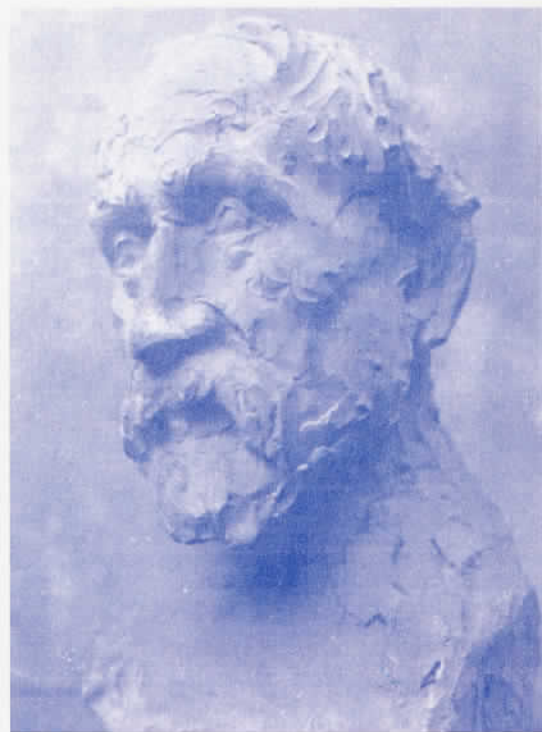
JOSEP GÜELL I MERCADER, ESBÓS ESCULTÒRIC DE JOAN REBULL.

republicans catalans , va fer valorar a l'alça el paper de Güell en el catalanisme.