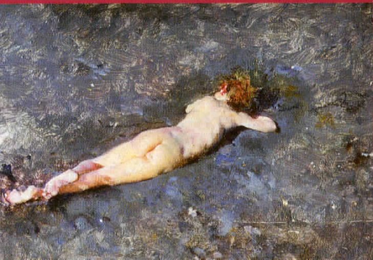
Nu a la platja de Portici , 1874 Museo Nacional del Prado, Madrid

per 70.000 francs. L'èxit és impressionant i reporta a Fortuny uns grans guanys. Al mes de maig l'exposa un altra vegada junt amb l'Encantador de serps , les aquarel·les El kief , El cafè de les orenetes (Walters Art Museum, Baltimore) i El venedor de tapissos . Fortuny es converteix en un dels artistes més valorats del moment i més buscats pels col·leccionistes.