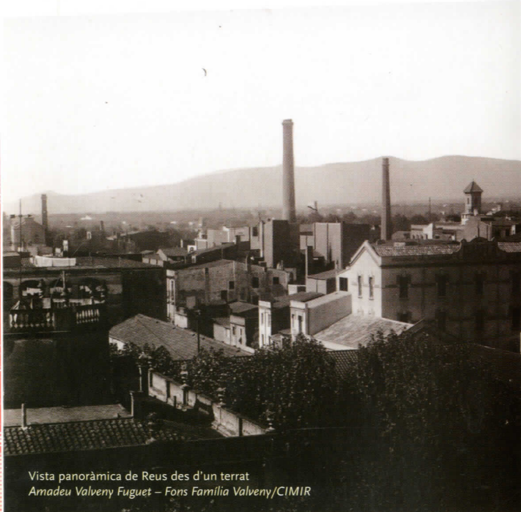
Vista panoràmica de Reus des d'un terrat

Al llarg de tot el segle XIX l'agricultura es mantingué com una activitat clau de l'economia reusenca, tant per ella mateix com per les indústries de transformació que nodria, sobretot les dedicades a l'obtenció d'oli i aiguardent.