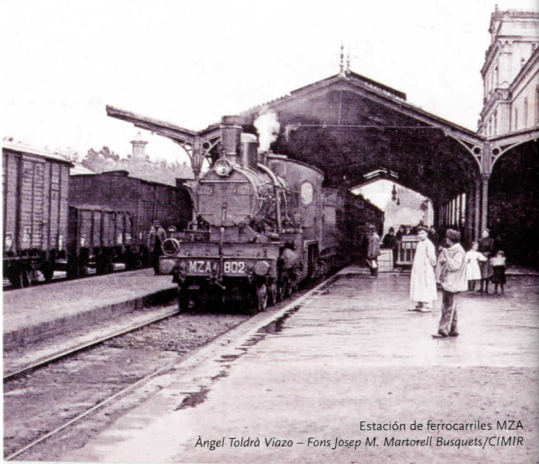
Estación de ferrocarriles MZA