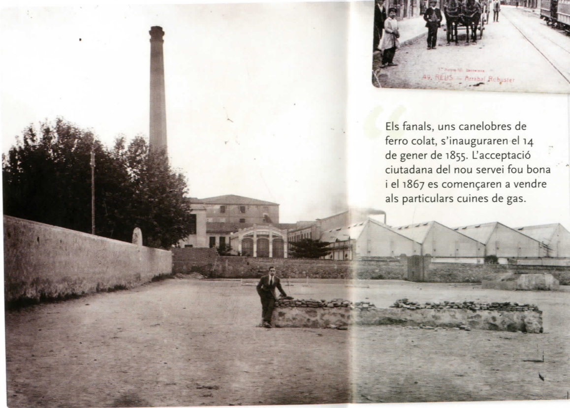
Arrabal de Robuster

No és fàcil fer-se una idea nítida de com era, i per tant com s'hi podia viure, al Reus de fa dos-cents anys. La imatge que oferia als ulls de tothom era la d'una vila preindustrial, amb molta vida al carrer, on la gent d'ofici hi treballava sovint aprofitant les hores de sol. Amb uns espais públics sense cap mena de comoditat, plens de pols a l'estiu i en èpoques de sequera o de fang al llarg de l'hivern... Això vol dir que encara eren molt pocs els espais públics empedrats. A primers de segle hi vivia una societat compartimentada en uns estaments ben definits, més per la professió que no pas per la riquesa, la pertinença als quals es feia evident al primer cop d'ull per les diferències en el vestir.