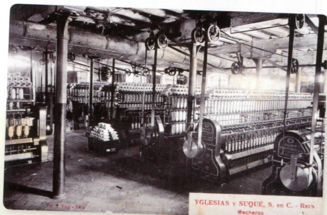
Mecheras.Yglesias y Suqué Puig, Esteve - Fotografía Artística – Fons Josep M. Martorell Busquets/CIMIR

SORONELLAS I MASDEU, Montserrat (coord.). Aquí es vé a triar! : els magatzems de fruita seca de Reus i el treball de les dones . Reus : Arxiu Municipal de Reus, 2003. CL 33 SOR