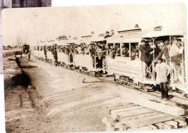
Viatge inaugural del Carrilet de Salou

El 1861 l'autor de Reus su pasado y su porvenir lloava l'empena dels fabricants: "hoy en día nuestras industrias sedera, algodónera y lanera constantemente vencen la competencia nacional y extranjera introduciendo innovaciones las más difíciles en sus artefactos para no quedar rezagados". A més, recordava, l'empena industrial absorbia la mà d'obra que l'ensorrada de l'aiguarent havia deixat en l'atur i la immigració d'origen rural.