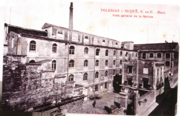
YGLIASIAS y SUQUÉ, S. en C. - Reus Vista general de la fàbrica Desconegut – Fons Josep M. Martorell Busquets/CIMIR

Malgrat l'impacte negatiu de les guerres de finals del XVIII i la primera dècada del XIX, la força comercial era notable.